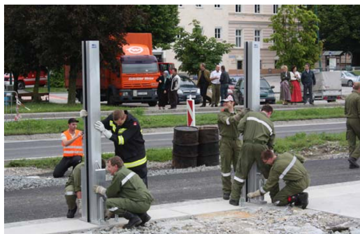
Befestigung der Steher fertiger Hochwasserschutz entlang der B3