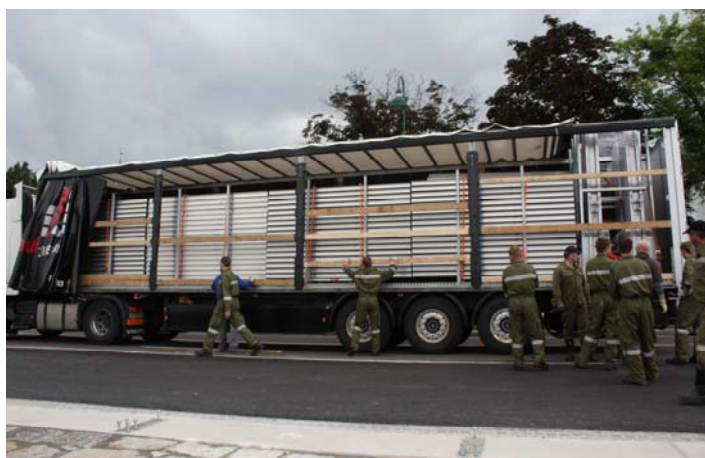
Anlieferung der Hochwasserschutz Elemente Einsetzen der Elemente