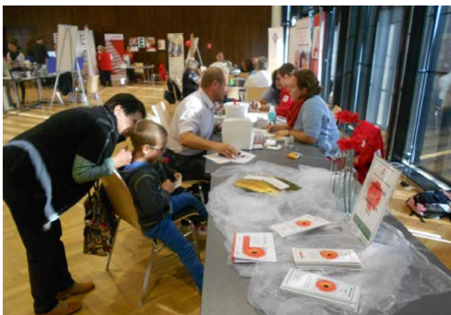
Gesundheitsstraße des Roten Kreuz (RR, Puls, Cholesterin, Zucker)