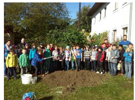
Die Schüler/innen nach der „großen“ Kartoffelernte

Die Kinder bereiteten aus ihrer Ernte eine gemeinsame Jause zu und genossen den Vormittag am Bauernhof.