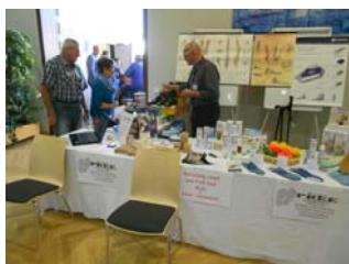
Ortho San Med Pree - Beratung rund um Fuß und Bein