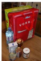
Die Bevorratungstasche des ÖO Zivilschutzes eignet sich ideal zur Lagerung Ihres Lebensmittel-Notvorrats!