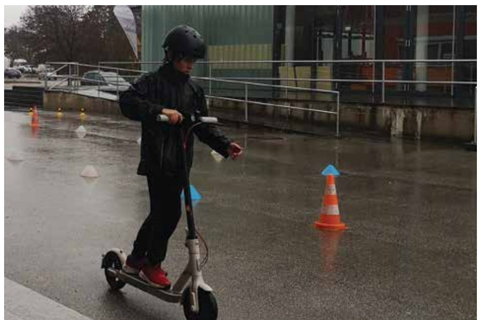
Es gibt kein schlechtes Wetter, schon gar nicht beim E-Scooter-Training.

Ebenso bekamen sie einen kleinen Einblick in die Jagd. Zu seinem