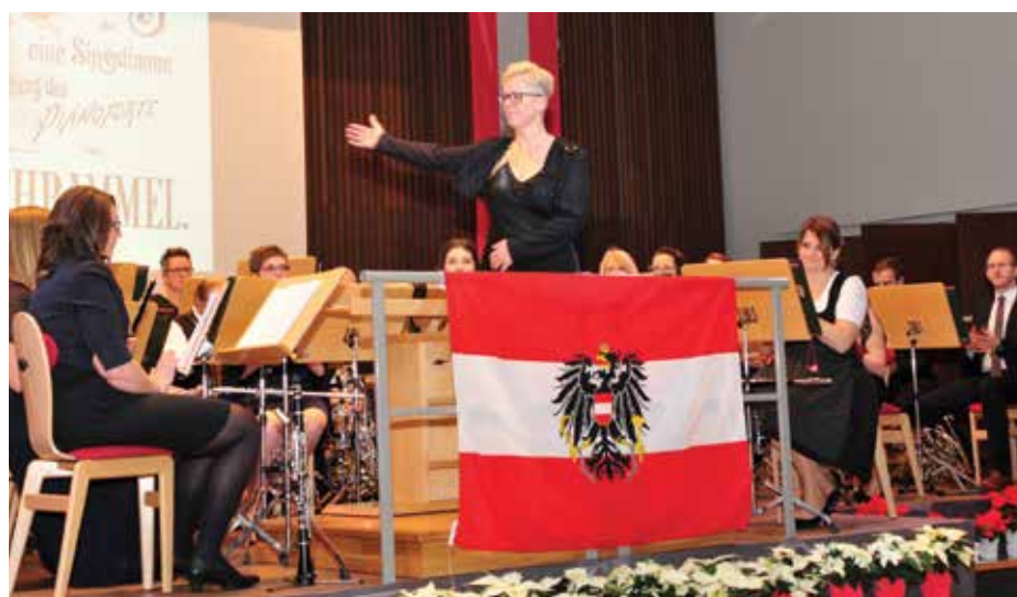
Das letzte Vereinskonzert fand im Dezember 2019 unter dem Motto Österreich statt.