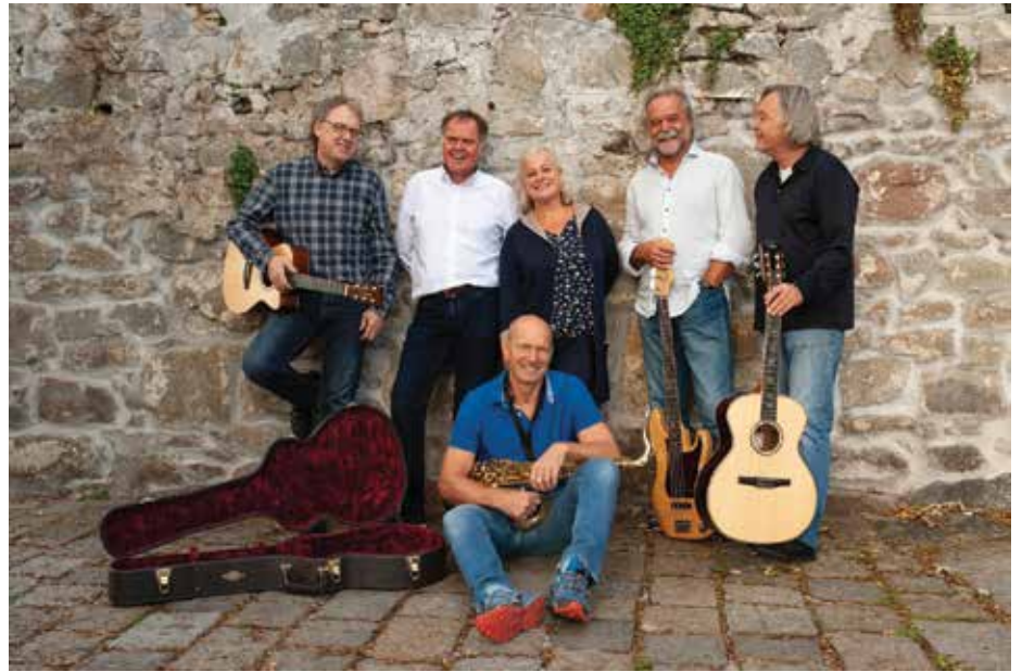
COMFOUR werden den Abend musikalisch gestalten.

als Veranstalter, sowie die Kooperationspartner ‚Mauthausen Tourismus‘ und ‚Rauscherhaus‘ freuen sich auf regen Besuch.