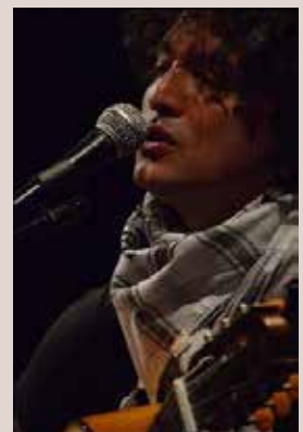
Nicolas Miquea © Jens Schulze

Neben diesen Veranstaltungen freuen wir uns Sie auch bei unseren Workshops, Rundgängen, Filmvorführungen und Ausstellungen begrüßen zu dürfen! Details dazu finden Sie auf der Homepage.