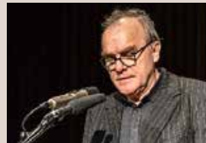
Michael Köhlmeier

In zärtlichen wie radikalen Worten hält Michael Köhlmeier in seinen Büchern ein Plädoyer für eine offene, humane Gesellschaft.