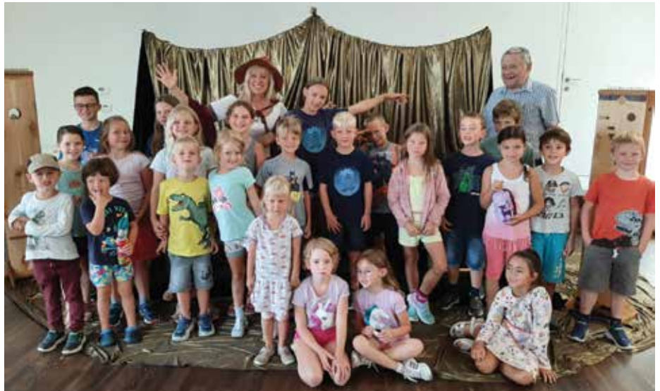
Begeisterte Kinder bei der Märchen- und Sagenlesung.

Im Rahmen von „Österreich liest. Treffpunkt Bibliothek“, dem größten Literaturfestival Österreichs, veranstaltet die Bibliothek Mauthausen am 20. Oktober um 10:00