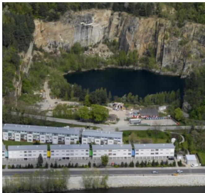
Geplantes Ausstellungsgelände für eine ev. Landesausstellung in Mauthausen.

Ich möchte mich, ungeachtet des Ergebnisses der Vergabe, bei allen bedanken, die an der Erstellung des Konzeptes mitgearbeitet haben. Vor allem danke ich Tanja Oswaldi, die sich für diese Bewerbung besonders engagiert hat.