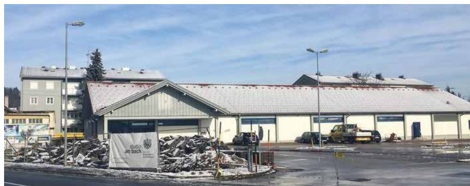
Die Arbeiten am ehemaligen Lidl Gelände schreiten voran. Stand Februar 2020

Äußerlich sichtbarer ist die Veränderung der ehemaligen Lidl-Filiale gleich nebenan. Hier entsteht eine neue Ausbildungsstätte des Vereins „SAUM“.