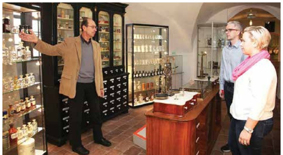
Jeden 1. Sonntag im Monat um 15Uhr: Sonderführung im Apothekenmuseum.

Alternativ zu diesen Führungen steht unseren Besuchern natürlich auch das moderne Audioguide-System für beide Museen zur Verfügung. Der Eintrittspreis bleibt unverändert bei 5€ für Erwachsene, für Schüler beträgt er 3€.