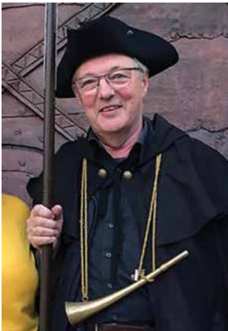
Nachtwächter ‚Gottfried vom Berge‘ führt durch das historische Zentrum von Mauthausen.

Die Eintrittspreise für die Nachtwächterrundgänge entsprechen