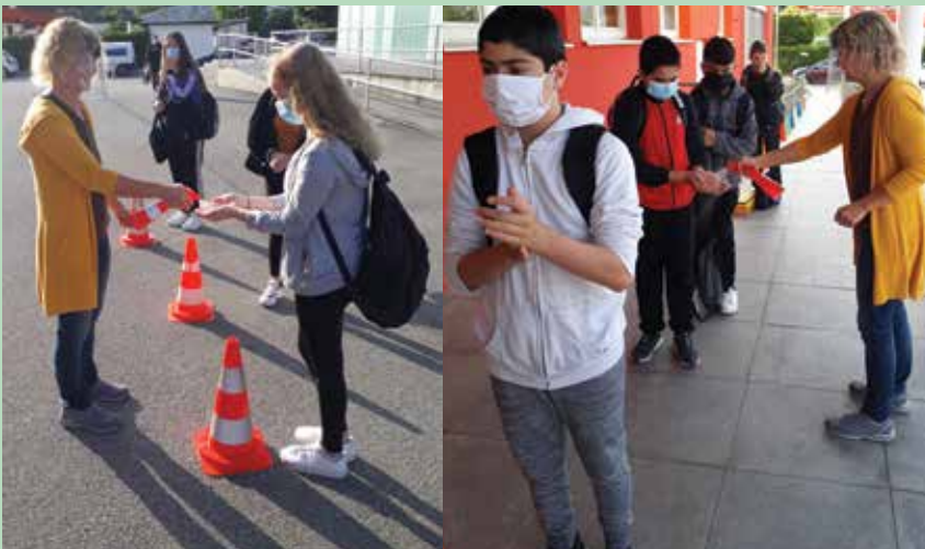
So sehen seit 18. Mai Beginn und Ende eines Schultages aus - Hände desinfizieren.

Neuer Schulbeginn am 18. Mai 2020 - von Sabine Speta