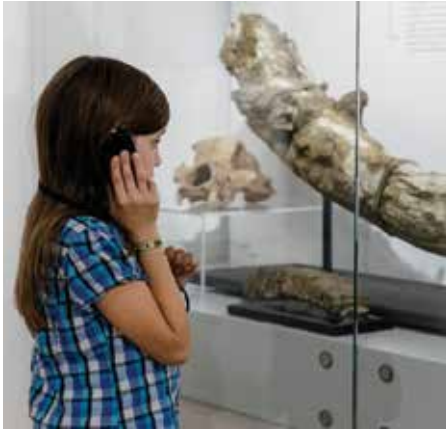
Der Audioguide bietet auch altersgerechte Texte für die jungen Museumsbesucher an.

Im Preis inbegriffen ist der Besuch beider Museen, die Teilnahme an den Sonderführungen im Apothekenmuseum, sowie die Benützung der Audioguides.