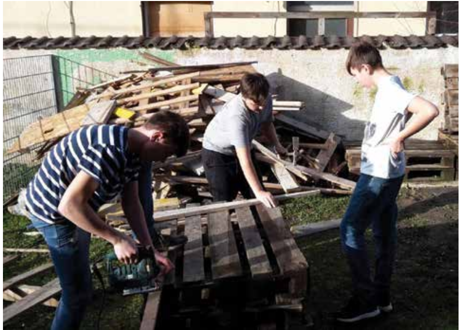
Auch handwerkliches Geschick wird gezeigt beim Besuch im JUZ.

In der „JUZ-freien“ Zeit haben wir uns auch etwas Neues einfallen lassen. Immer wieder war es der Wunsch, auch sonntags im Jugendzentrum sein zu können. So haben wir die Öffnungszeiten für euch geändert: