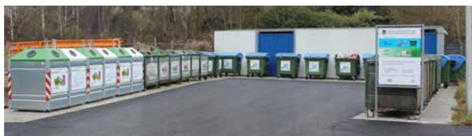
Der neu gestaltete Entsorgungsplatz ist bereit für die Entsorgungstätigkeiten.

Die Höhepunkte waren zweifelsohne wiederum der Besuch des Nikolaus und der Perchtenlauf.