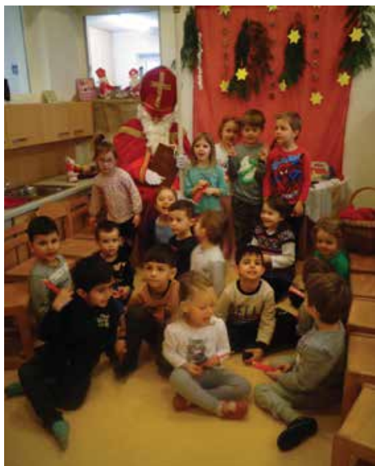
Auch heuer stattete der Nikolaus den Kindern im Kindergarten einen Besuch ab.