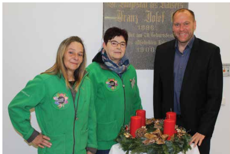
Die Mitarbeiter/innen überreichen den Adventkranz.

Wir bedanken uns für diese Spende und auch für die sonstige gute Zusammenarbeit mit der Firma Bellaflora.