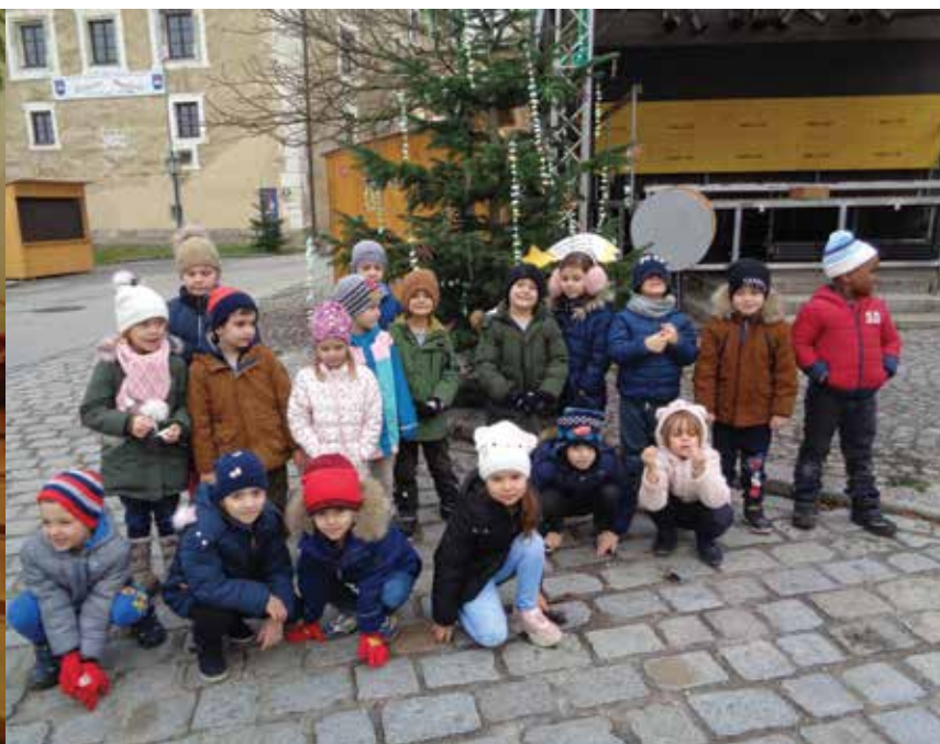
Die Kinder schmückten den Christbaum beim Adventmarkt mit selbstgebastelten Sternen.