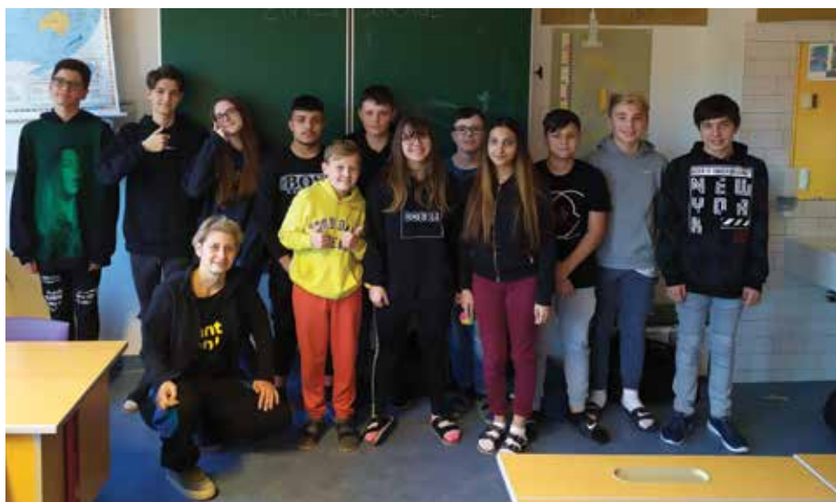
Die 4 A lernt hinzuschauen anstatt wegzuschauen.

Eine Bildung des Herzens und des Gewissens. Schülerinnen und Schüler lernen hinzuschauen anstatt wegzuschauen, miteinander zu sprechen anstatt zu schweigen und offen für Neues zu bleiben. Das