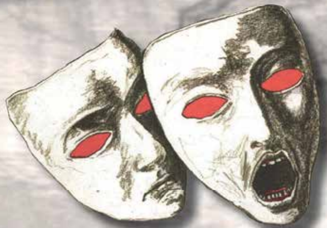
Illustration: Georg Feierfeil

Ein Polittheater von Doron Rabinovici und Florian Klenk