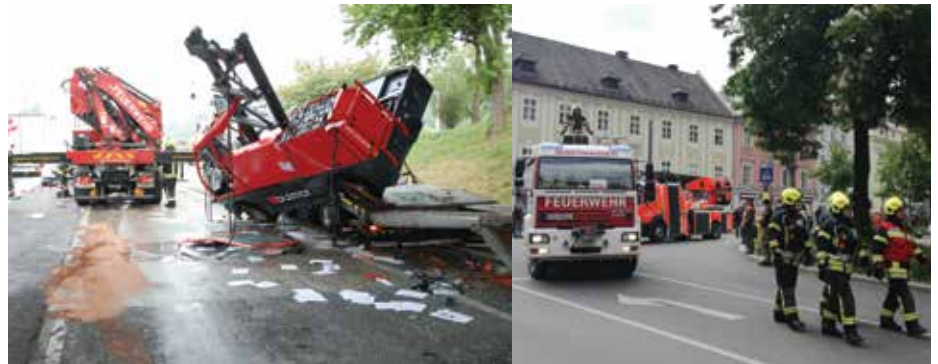
Insgesamt waren es 17 Brandeinsätze und 108 technische Einsätze, die für die Öffentlichkeit geleistet wurden.

Zum Glück blieben 2019 Großschadensfälle aus, und so be-