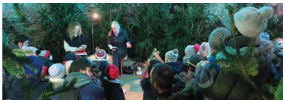
Der Märchenwald im Schloss Pragstein und die Geschichten am Lagerfeuer begeisterten die Kinder.

Schon am 8. Dezember gab es den „Weihnachtlichen Märchenzauber“ für Kindergarten- und Volksschulkinder im Schloss Pragstein. Über 300 Besucher (Kinder mit Begleit-