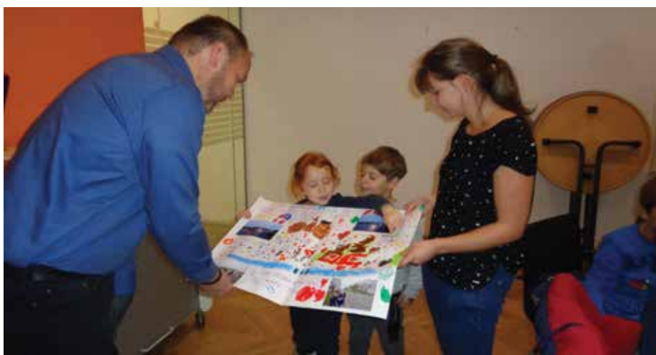
Die Kinder präsentieren dem Bürgermeister ihre Wünsche in Form einer Zeichnung.