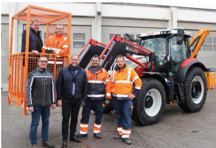
Dem Winterdienst steh nichts mehr im Wege.

Jeder „Fehlwurf“ verursacht zusätzliche Kosten für uns alle und daher ersuche ich auch um Verständnis, dass alle „Müllsünder“ von uns zur Anzeige gebracht wer-