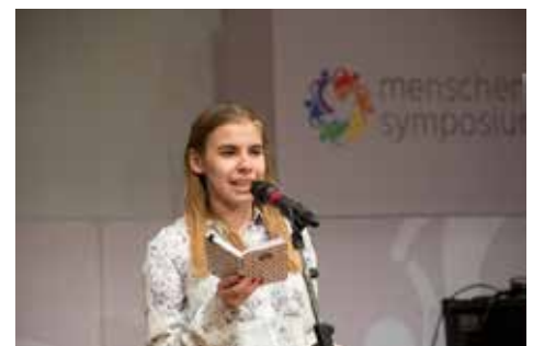
Freitag 19:30 Poetryslam mit dem Verein Post Skriptum