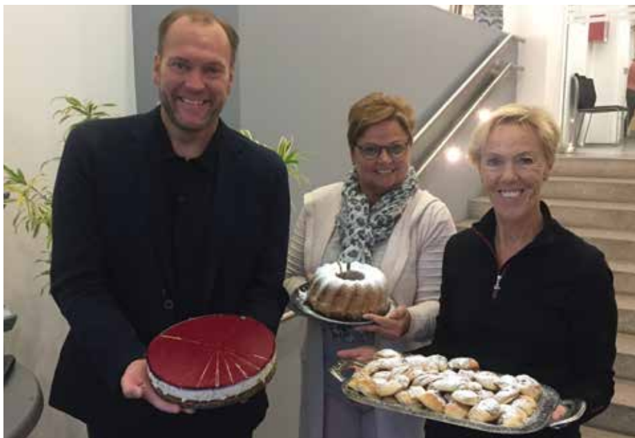
Diese und zahlreiche andere Köstlichkeiten gab es über das Jahr verteilt beim Kuchensprechttag zu genießen.

Heutzutage besucht man das Heimatmuseum mit eigenen Audio-guides in verschiedenen Sprachen und für mich ganz besonders beeindruckend, es gibt eine eigene Führung in kindgerechter Sprache.