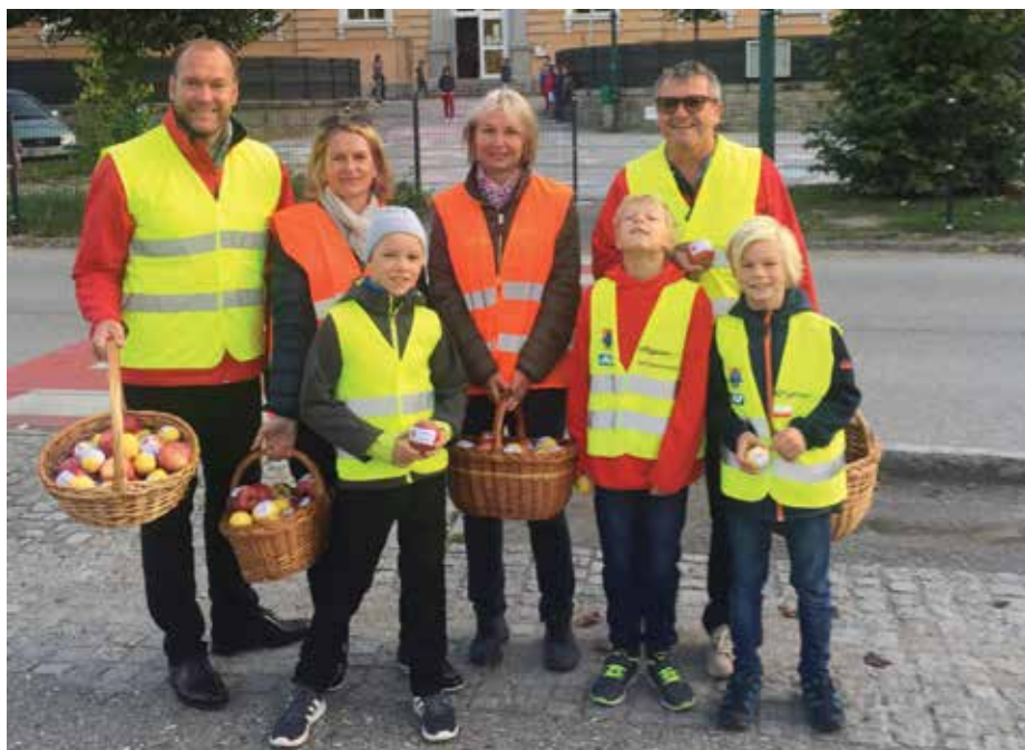
Die Sicherheit am Schulweg wird in Mauthausen groß geschrieben.