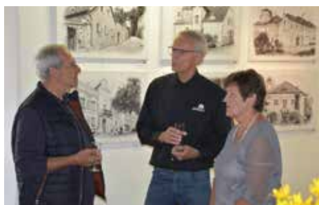
Die Fotoausstellung in der ‚Galerie im Schloss‘ begeisterte.