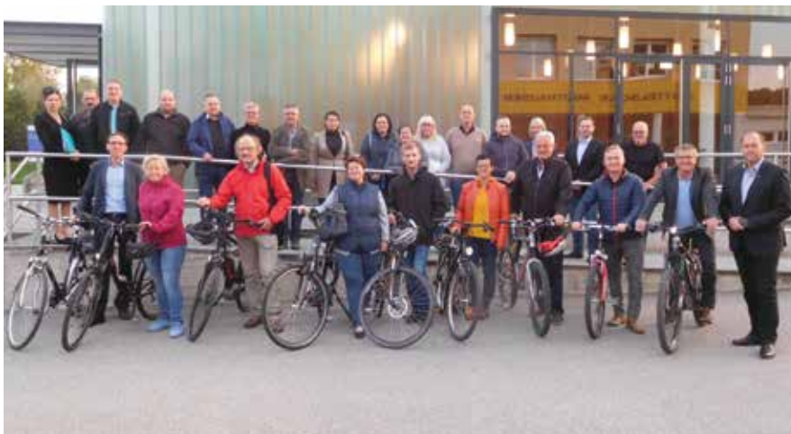
Die Gemeinderäte erschienen mit dem Fahrrad zur GemeindeRadsitzung.

Eine kurze Übersicht zu den Aktionen in der europäischen Mobilitätswoche - von Anita Peterseil