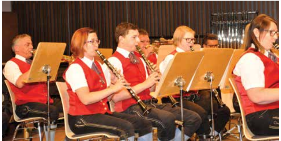
Immer am ersten Samstag im Dezember findet das traditionelle Vereinskonzert statt.

Die Marktmusik Mauthausen lädt Sie beim diesjährigen Vereinskonzert ein, diese Vielfalt live zu erleben. Freuen Sie sich im Donausaal auf traditionelle Blasmusik aus allen Bundesländern, allseits bekannte Austropop-Melodien und Werke österreichischer Künstler, die auch über unsere Grenzen hinaus begeistern.