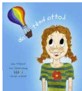
Samstag 14:00-17:00 Elterncafe und Theater zum Mitmachen für Kinder von 2 bis 9 Jahren