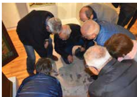
Spurensuche auf der Urmappe im Heimatmuseum.