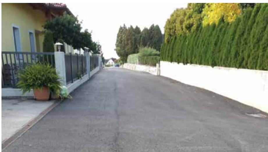
Der Asternweg erstrahlt in neuem Asphalt-Glanz.

ten sehr gut angenommen wird, werden auch weitere Lebensmittelgeschäfte ihre Märkte modernisieren und das Angebot für die Kunden verbessern. So hat der bestehende Hofer-Markt um eine Erweiterung der Verkaufsfläche angesucht und der Penny-Markt wird am bestehenden Standort völlig neu gestaltet. Demnach war es sicherlich eine gute Entscheidung, den Neubau des Lidl zu forcieren, weil sich dadurch das Angebot für die Menschen in Mauthausen wesentlich verbessert hat und noch weiter verbessern wird.