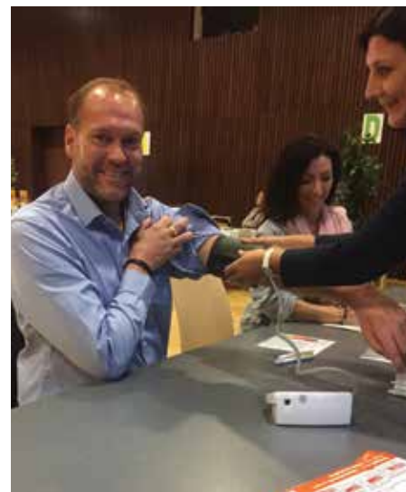
Eine kurze Kontrolle am Gesundheitstag kann nie schaden.