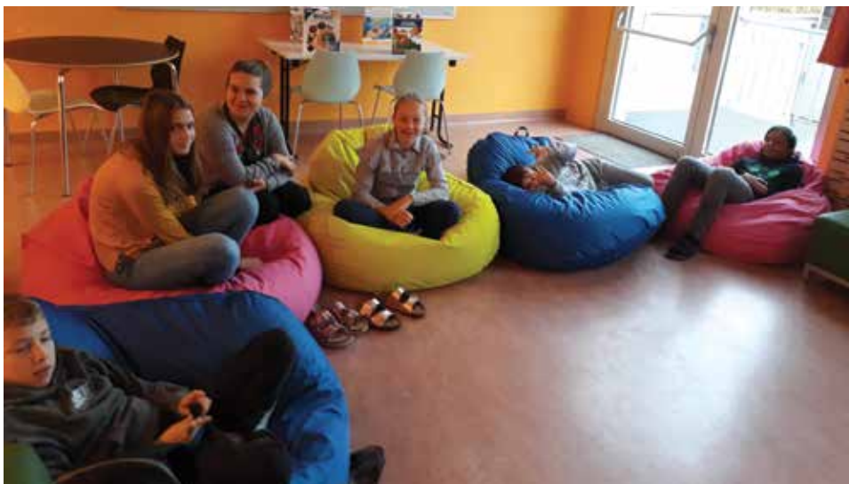
Morgens noch etwas verschlafen im YOLO-Raum.