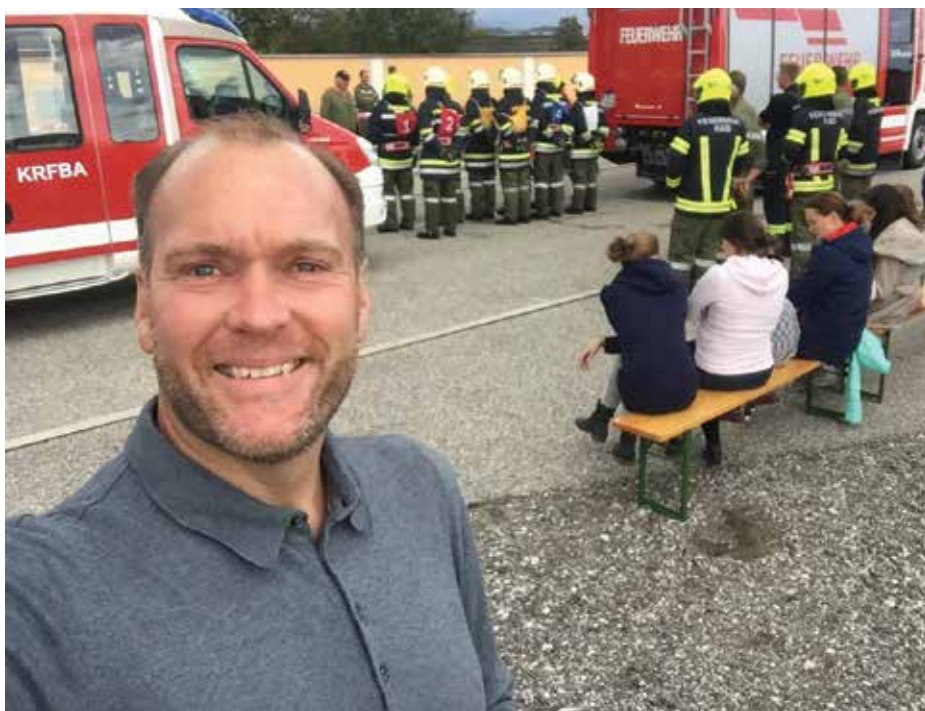
Die Feuerwehren präsentieren sich auf großem Ausbildungsniveau.

Sehr großer Andrang war am 01. Oktober 2019 in der Stadthalle Enns zur öffentlichen Verhandlung der Erweiterung des „Rohstoffparks Bernegger“ im Ennshafen. Ich war gemeinsam mit dem Bauamtslei-