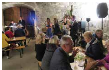
Humorvoller und beschwingter Abschluss im Schlosskeller.

museum.markt mauthausen Heimat- und Museumsverein Schloss Pragstein