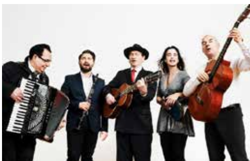
Samstag 19:30 Wiener Tschuschenkapelle im Gedenken an die Reichspogromnacht