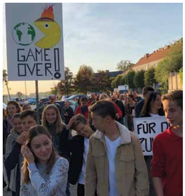
Rege Teilnahme beim ersten Friday for Future.