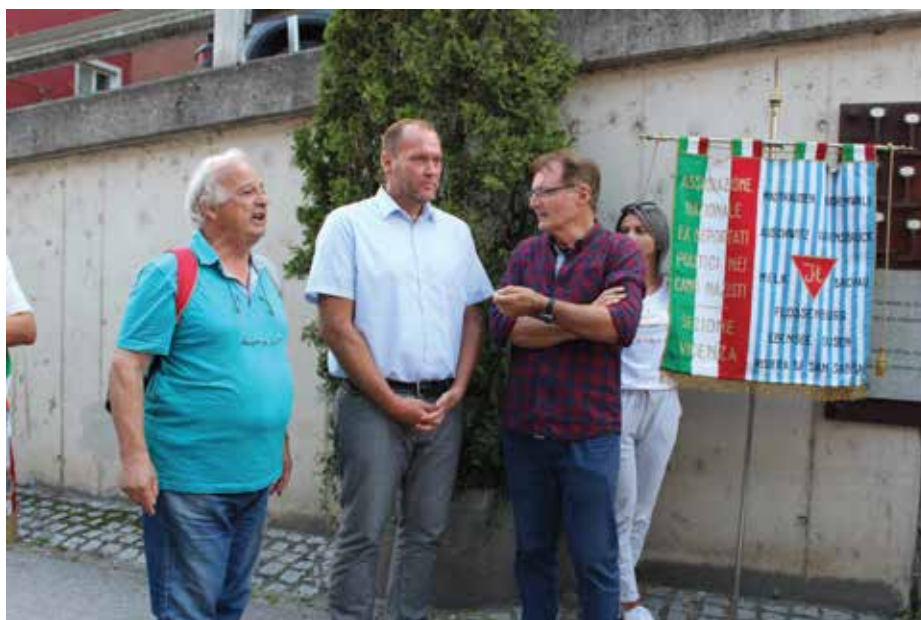
Zum 17. Mal besuchte eine Delegation aus Thiene unser Mauthausen.