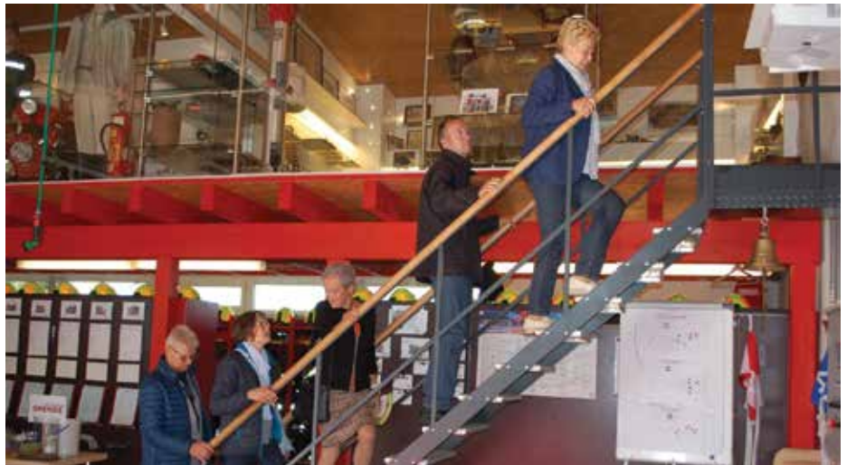
Aufstieg zum FF-Museum.

Die Bilder geben einen kleinen Eindruck von der erfolgreichen Veranstaltung.