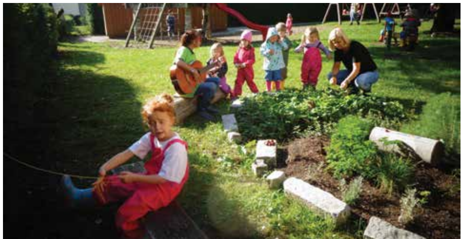
Frisch geerntet schmecken die Kräuter und das Gemüse am Besten.

Am 11. November 2019 findet unser traditionelles Martinsfest statt. Das Kindergarten team würde sich freuen, wenn viele Eltern, Großeltern, Tanten, Onkeln, ... mit uns das Fest feiern.