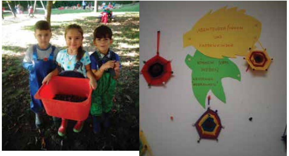
Erst wurden Kastanien gesammelt und anschließend verwebt in den Garderoben ausgehängt. © Maurer