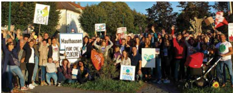
Die Beteiligung war groß beim ersten „Friday for Future“ in Mauthausen® Hofstätter

Es gibt keinen zweiten Planeten und daher braucht es dringend eine Kehrtwende in der Klima- und Umweltpolitik.