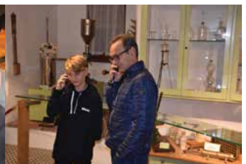
Die neuen Audioguides haben auch im Apothekenmuseum die erste Bewährungsprobe bestanden.