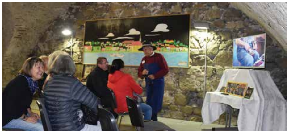
Interessierte beim INFO-Stand des Schustermuseums.