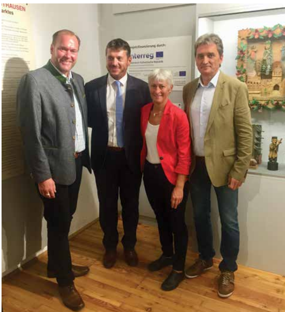
Sichtliche Zufriedenheit ist bei den OrganisatorInnen zu erkennen.