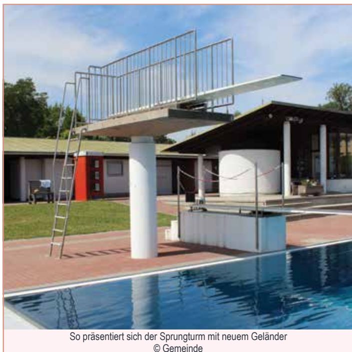
So präsentiert sich der Sprungturm mit neuem Geländer

Diese Umstände erforderten eine Adaptierung der Badeordnung und eine Umstellung bei den Saisonkarten und 10er-Blöcken. Das Freibad ist mit Gültigkeit der neuen Badeordnung vom ersten Freitag im Monat Mai bis zum Sonntag vor Schulbeginn geöffnet.