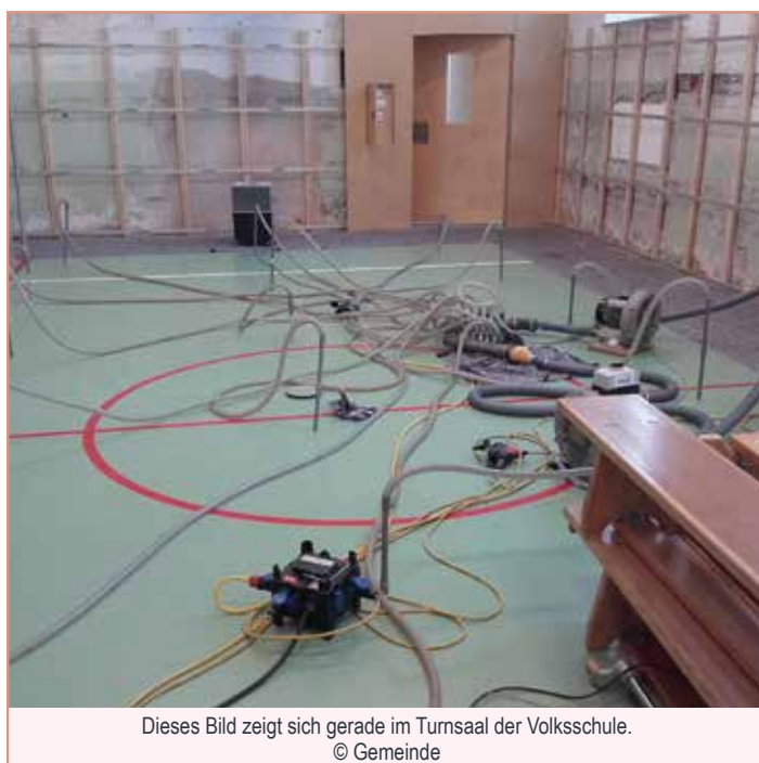
Dieses Bild zeigt sich gerade im Turnsaal der Volksschule.

Für alle eingemieteten Vereine und Institutionen ist der Turnsaal zu Schulbeginn im September wieder voll benutzbar. Erforderlich dafür ist der Neuabschluss einer Nutzungsvereinbarung am Gemeindeamt.