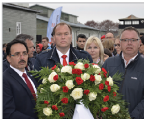
Kranzniederlegung in der KZ Gedenkstätte Mauthausen