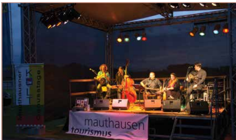
Eine Veranstaltung der Kulturgenusstage 2016