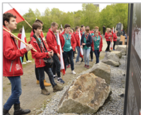
Jugendliche aus Italien und Polen beim „Bergkristall“