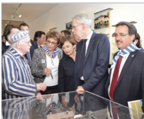
BP Dr. Alexander Van der Bellen am Memorial Gusen