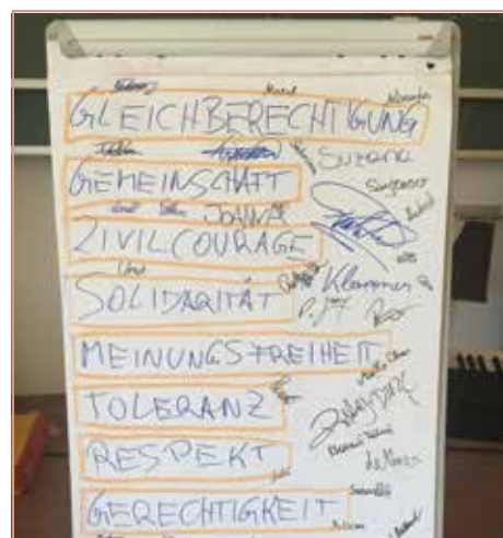
Die 4. Klassen befassen sich eingehend mit der Geschichte

Gemeinsam haben wir festgestellt, dass es gewisse Parallelen zur Gegenwart gibt. Auch heute gibt es in Europa Armut und Verzweiflung zum Beispiel durch Arbeitslosigkeit. Auch heute nimmt man in Europa und vielen Regionen der Welt eine wachsende Radikalisierung wahr. Diese Entwicklung wird von den jungen Menschen in der NMS Mauthausen ganz treffend analysiert. Beeindruckt hat mich die Erkenntnis, dass „Radikali-