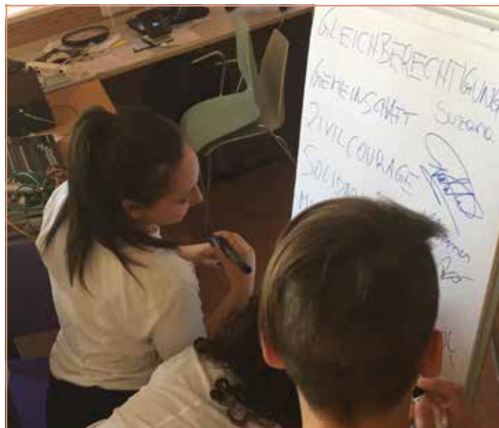
Angestrengt wird an den Werten der heutigen Zeit gearbeitet.