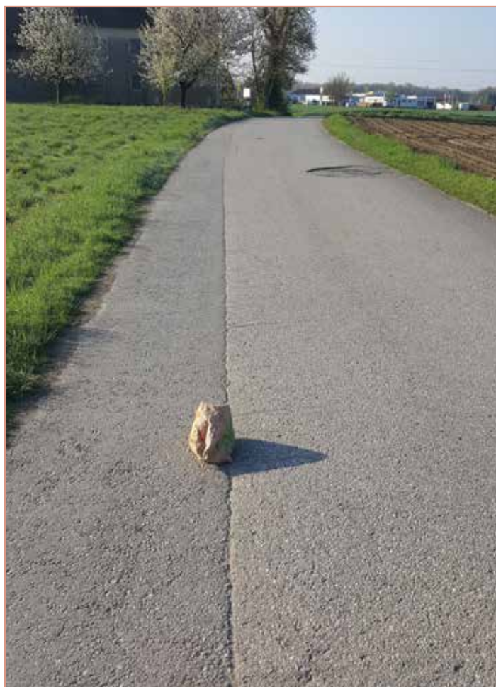
Solche und ähnliche Fotos erreichen uns von verärgerten GemeindegängerInnen.