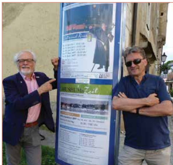
Die Obmänner des Tourismusverbandes und des Heimat- und Museumsvereins präsentieren die neue Veranstaltungsanzeige

Mit der grundlegenden Renovierung des ehemaligen Traditionsgasthauses Lumplecker am Heindlkai und der Zimmererweiterung durch Herrn Adolf Wegscheider wurden rund 30 neue Fremdenzimmer geschaffen. Nach dem Umbau des Donauhofes und der voraussichtlichen Fertigstellung im Frühjahr 2018 stehen auch hier Qualitätszimmer für unsere Gäste und Besucher des Donaumarktes zur Verfügung. Diese Maßnahmen sind aus touristischer Sicht äußerst begrüßenswert und wir danken den Betreibern für ihren Einsatz!