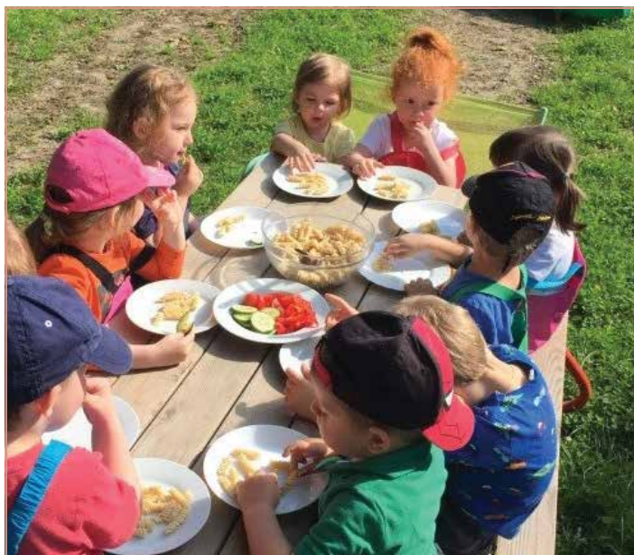
Die Kinder genießen die gesunde Jause im Freien.

Endlich ist es draußen so richtig warm und wir sind jeden Tag im Garten. Auch die Jause genießen die Kinder bereits im Freien. Da schmeckt sie auch gleich nochmal viel besser. Nach der Stärkung geht es dann ab zum Spielen, egal ob in die Nestschaukel oder in die Sandkiste, bei diesen Temperaturen macht es richtig Spaß.