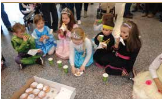
Faschingsumzug im Donaupark