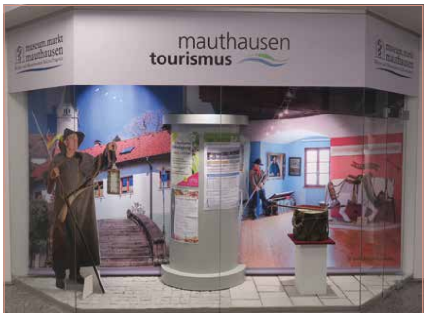
Die neue, gemeinsame Schauvitrine im Donaupark