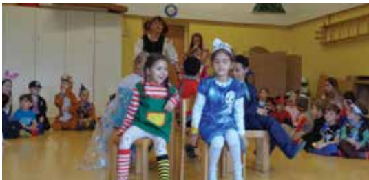
Reise nach Jerusalem