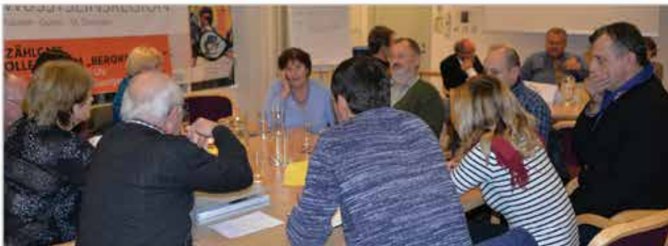
Erzählcafe 2016: Moderierte Tischgespräche mit Fotos und Berichten von Zeitzeugen die im Zusammenhang mit dem „Stollensystem Bergkristall“ stehen.

(aus der Einladung zur Gründungsfeier Nov. 2016)