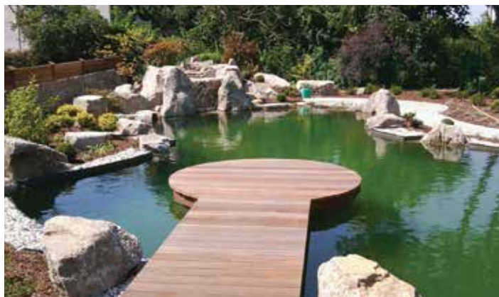
Das Anmelden einer Befüllung des Schwimmteiches oder Schwimmbades verhindert eine eventuelle Wasserknappheit.

Bei der erstmaligen Befüllung wird keine Kanalbenutzungsgebühr verrechnet. Für jede weitere Befüllung sind sowohl die Wasserbezugs- als auch die Kanalbenutzungsgebühren zu entrichten.