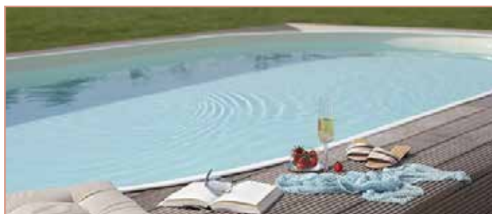
Schwimmbäder tragen zur Entspannung und Regeneration bei. Die Abwässer müssen aber über die Kanalisation entsorgt werden.

S ie können Ihr Schwimmbad über die hauseigene Wasserleitungsanlage bzw. über Hydranten durch die Feuerwehr befüllen. Dafür ist die Kanalbenutzungsgebühr zu bezahlen, da die Schwimmbäder in der Regel auch am örtlichen Kanalnetz hängen und über dieses rückgespült und das Wasser auch abgelassen wird. Schwimmbadabwässer sind sogenannte bedenkliche Abwässer und müssen somit in den Kanal geleitet werden.