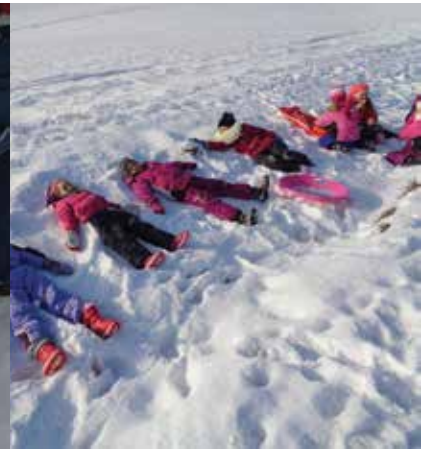
Der Schneengel