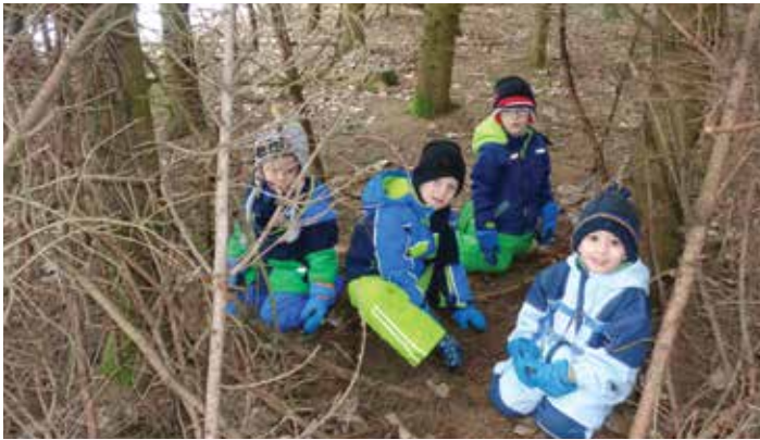
Die Waldgruppe genießt den Winter mit und ohne Schnee.