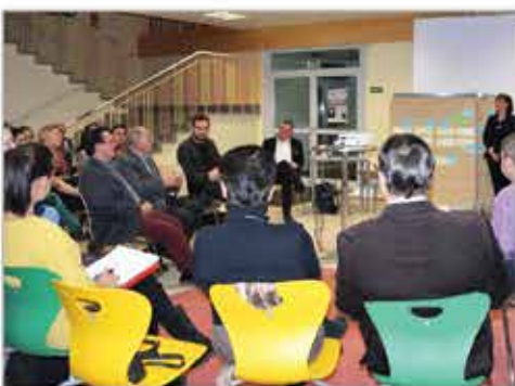
1. Treffen der Arbeitsgemeinschaften im Jänner