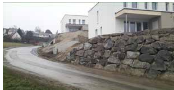
Momentaufnahme Dezember 2016

Großprojekt am Hügel des alten Seniorenheimes: Die Reihenhäuser sind fertiggestellt. Auf dem Bild ist eindeutig erkennbar, dass der im Prospekt beworbene Grüngürtel durch eine wuchtige, beinahe senkrechte Steinmauer ersetzt worden ist. Diese Steinmauer hat dazu geführt, dass sich die Sicht und damit die Verkehrssicherheit innerhalb der Kurve massiv verschlechtert haben. Erhöht hat sich allerdings das Gefahrenpotenzial! Die aufgeschüttete, steile Böschung birgt bei Starkregen die akute Gefahr der Verschlammung des Kanals.