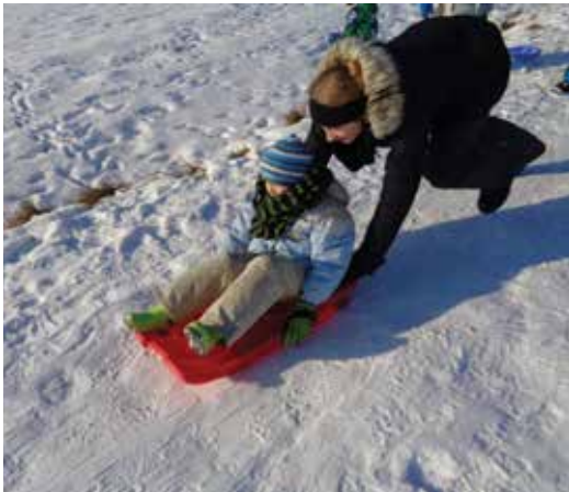
Die Schulanfänger/innen gingen an ihren Aktivitätentagen zum Flitzi-Rutschen.