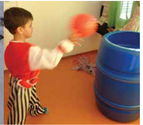
Ausgelassen wird der Rosenmontag gefeiert.