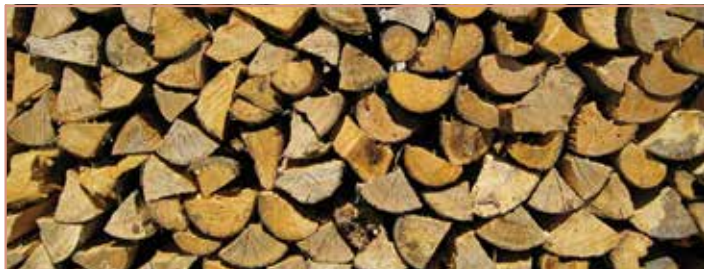
Auch das Einschlagen herausstehender Holzscheiter gehört zu den lärmeregenden Arbeiten.

V ermehrt ziehen in letzter Zeit in manchen Siedlungsgebieten trotz herrlichem Sonnenschein düstere Wolken auf. Der Grund dafür ist leicht erklärt. Jeder möchte gerne das Wochenende nutzen, um zu entspannen und die leeren Tanks wieder aufzufüllen. Doch scheinbar gibt es immer wieder Menschen im Umfeld, die am Wochenende keine leeren Tanks haben und die Energie nutzen um den Rasen zu mähen, Holz zu hacken oder sonstige lärmeregende Arbeiten durchzuführen. All diese Tätigkeiten mögen an Samstagen ab 14:00 Uhr sowie an Sonn- und Feiertagen zur Gänze unterlassen werden.