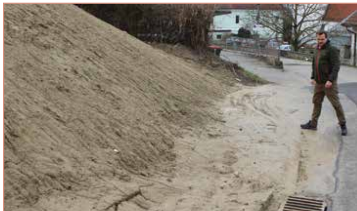
Begehung zur Besichtigung der Verunreinigungen und Abschwemmungen 10.03.2017

Bereits vor mehreren Wochen wurde seitens der Gemeindeverwaltung mit den zuständigen Baufirmen und Wohnungsgenossenschaften Kontakt, betreffend Stützmauern und Böschungen bei der aktuellen Baustelle - ehem. Seniorium, aufgenommen. Betreffend der aktuellen Abschwemmungen und Einleitungen des Erdreiches in den Kanal wurden die Baufirmen und die Wohnungsgenossenschaft ebenfalls informiert und es wurde die Behebung zugesagt.