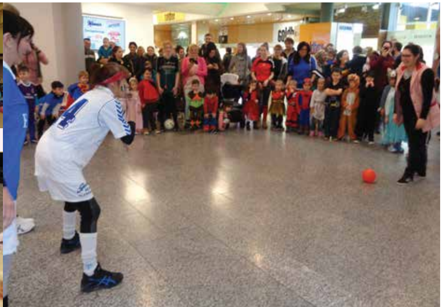
Auch die Eltern wurden ins lustige Faschingstreiben mit einbezogen

Die Kinder tanzten den „Schüttelfisch“ und den „Cowboy Bill“. Danach gab es als Stärkung für jedes Kind einen Faschingskrapfen und Saft. Das gesamte Kindergartenteam möchte sich bei den Geschäften für die vielen Geschenke und beim Donaupark sehr sehr herzlich für die Faschingsjause bedanken. Im nächsten Jahr ziehen wir wieder am Faschingsdienstag durch den Donaupark.