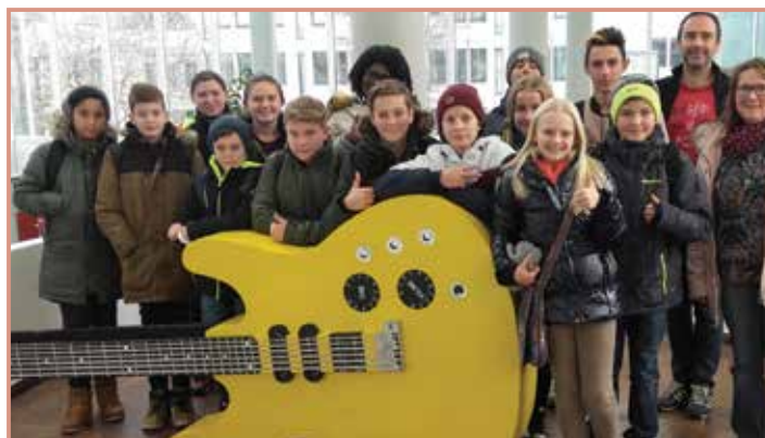
Die SchülerInnen im Studio von Life Radio.

Abschließend durften die Schülerinnen und Schüler in der Linzer Innenstadt Passanten zu aktuellen Themen interviewen. Aus den Antworten der Befragten PassantInnen entstand ein gelungener Radiobeitrag.