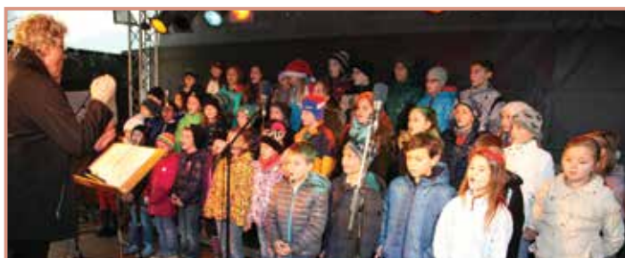
Fixer Bestandteil des Adventmarktes sind die Kinder des Chores der VS Mauthausen