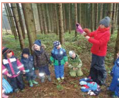
Die Farbenkinder bei ihrer Expedition im Wald

Ein herzliches Dankeschön geht an die Veranstalter für die Nikolaus-sackerl und an die Eltern, dass sie zur Eröffnung gekommen sind.