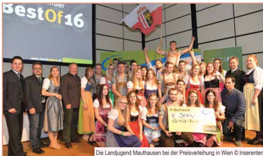
Die Landjugend Mauthausen bei der Preisverleihung in Wien

Das Integrationsprojekt "We say no to racism" wurde bei der Bundesprämierung "Best of 2016" im Austria Center in Wien mit der Aus- zeichnung Gold prämiert