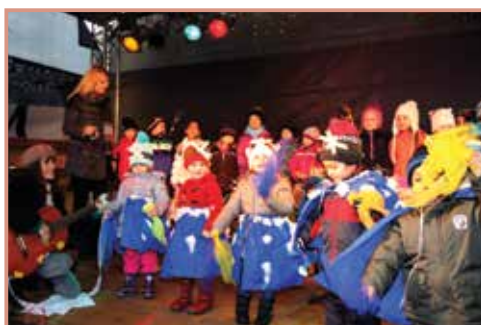
Die jüngsten Kindergartenkinder bei ihrem Schneeflockentanz am Adventmarkt.