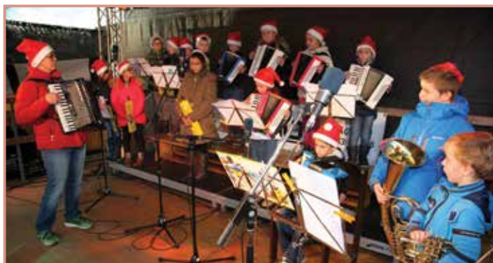
Die Akkordeon- und Melodikgruppe der Musikschule Föhlich konzertiert gemeinsam mit den Jungmusikerinnen der Marktmusik Mauthausen