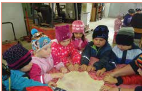
Natürlich durfte ein selbstgezogener Apfelstrudel nicht fehlen.