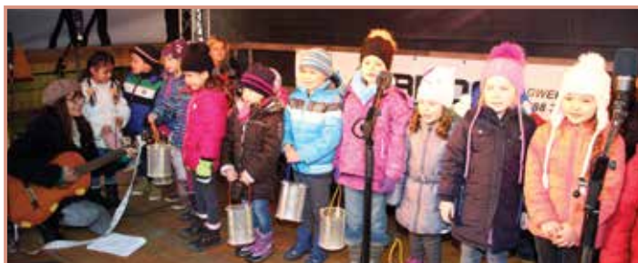
Jedes Jahr eröffnen die Kinder des Kinderfreunde-Kindergartens den Adventmarkt

Ein großer Dank gebührt Allen, die dazu beigetragen haben, dass der Adventmarkt auch heuer wieder ein großer Erfolg wird. Den vielen helfenden Händen, den MitarbeiterInnen von Bauhof und Gemeindeamt, den Mitgliedern des Kulturausschusses, den Feuerwehren, den Kulturschaffenden, dem Tourismusverband und der Neuapostolischen Kirche.