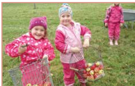
Bei der Cilli-Bäuerin in Hartl pressten die SchulanfängerInnen Apfelsaft mit vollem Arbeitseifer. Einsammeln der Äpfel - Waschen - Häckseln - Pressen.

Apfelsaft pressen, Waldtag, Martinsfest und Adventmarkt waren die Highlights des Kindergartens