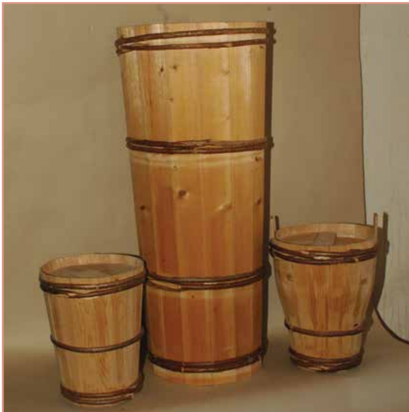
Großkufen und Küffel im Heimatmuseum Mauthausen

Seit der Erneuerung des gesamten Salzwesens durch Königin Elisabeth wurden fest umschriebene Zuständigkeitsbereiche vom Bergbau bis zum Konsumenten eingeführt: Die Eisenhauer als eigentliche Bergknappen, welche die Stollen vorantrieben, das Wasser einleiteten und die salzhaltige Sole in Rohren ins Tal zu der Sudpfanne brachten. Letztere war an mehrere Genossen verpachtet. Dort wurde die Sole gesotten und das so gewonnene Salz in konische Fuder gestoßen. Nach dem Trocknen wurden diese gekippt und im Pfiesel (Trockenstube) gedörrt. Diese „nackten Fuder“ (à 25 kg) wurden an die Salzfertiger ausgegeben, die sie wieder zerstoßen und in kleinere Küffel abfüllen ließen. Das waren doppelkonische Holzgefäße mit ca 7 kg Gewicht, die dann mittels angeheuerten Schifflenten in den Handel gebracht wurden. Salzfertiger gab es in Hallstatt, Laufen, Ischl und Gmunden. Ihre Zahl war genauestens geregelt.