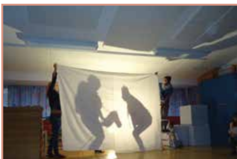
Unter dem Motto „Martin teilt den Mantel“ wurde das traditionelle Martinsfest gefeiert. Zur Überraschung der Besucher und der Kindergartenkinder spielten die Betreuerinnen die Martinslegende als Schattentheater.