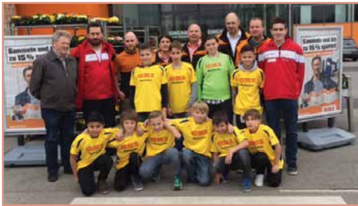
Die Jugendmannschaft der ASKÖ Mauthausen mit den neuen Dressen