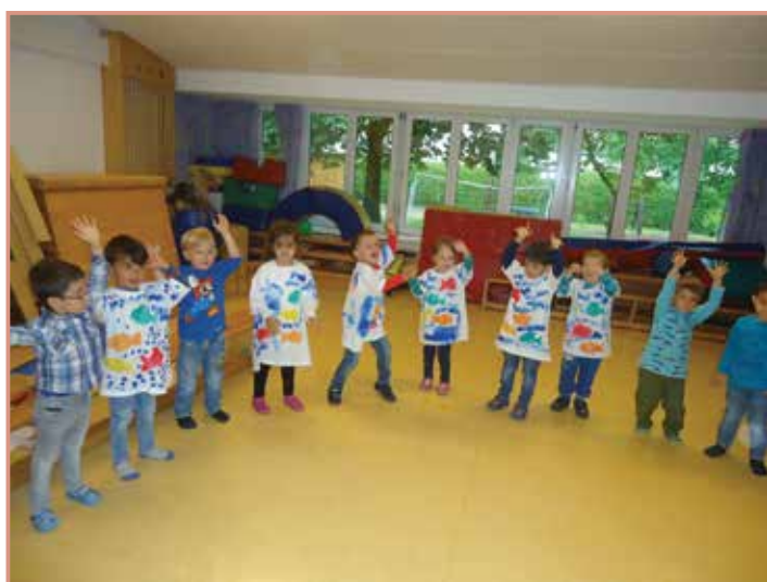
Die Kinder tanzen gemeinsam den Regenbogentanz.

Am Sonntag, den 26. Juni 2016, feierte der Kinderfreunde Kindergarten das Familienfest. Das Bilderbuch „Der Regenbogenfisch“ wurde beim Fest dargestellt. Die Kinder gestalteten ihre Kostüme selbst und es wurden Lieder und Tänze aufgeführt.