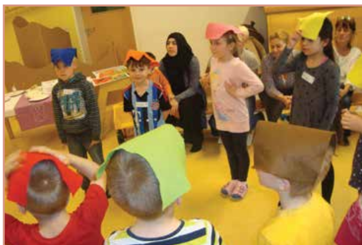
Mit volstem Einsatz sind die Kinder dabei.