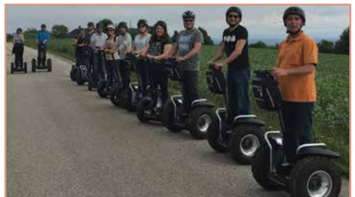
Begeisterte Teilnehmer einer Segway-Panoramatour.