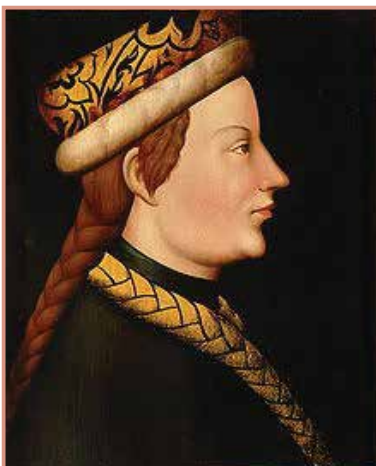
Herzog Albrecht III. mit dem Zopfe (1365 -1395)

Fortsetzung unter „Allen Herren Recht getan ...“