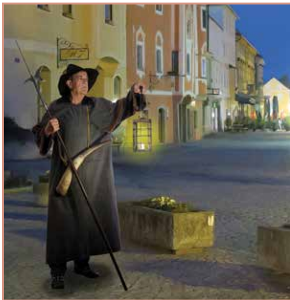
Die Rungänge mit dem Nachtwächter sind besonders beliebt