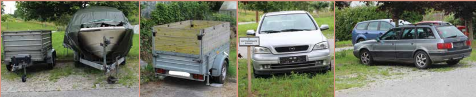
So stellt sich der Parkplatz in der Ufer Straße momentan dar.

Widerrechtlich abgestellte Fahrzeuge, also jene, die ohne Kennzeichen auf einem freien Parkplatz stehen, sind zu entfernen. Ebenso die Fahrzeuge von Bewohner/innen, die nicht mehr in Mauthausen wohnen, aber dennoch einen PKW oder Anhänger dort stehen haben.