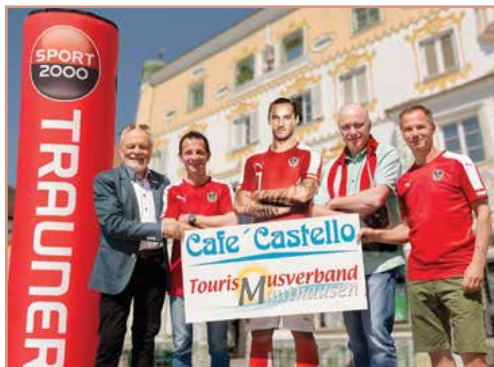
Keine-Fußball EM ohne Public-Viewing am Heindlkai.

Der Tourismusverband wünscht einen erholsamen Sommer im Donaumarkt Mauthausen!