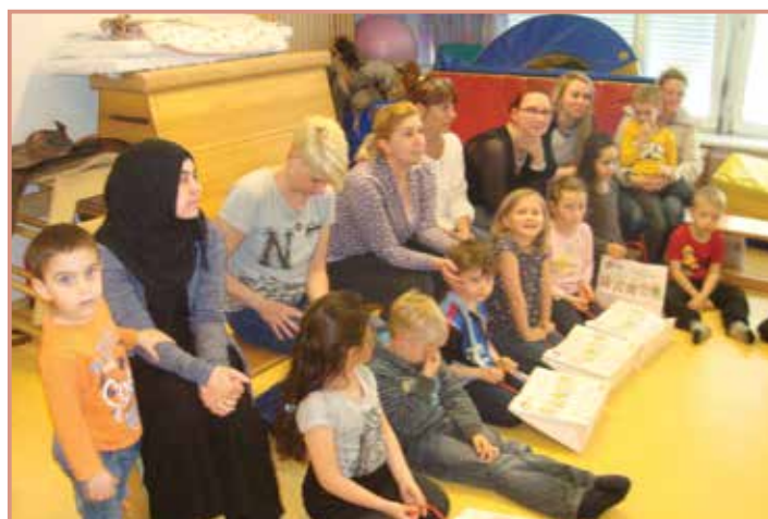
Aufmerksam hören Eltern und Kinder zu.

Am Sonntag, den 26. Juni 2016, feierte der Kinderfreunde Kindergarten das Familienfest. Das Bilderbuch „Der Regenbogenfisch“ wurde beim Fest dargestellt. Die Kinder gestalteten ihre Kostüme selbst und es wurden Lieder und Tänze aufgeführt.