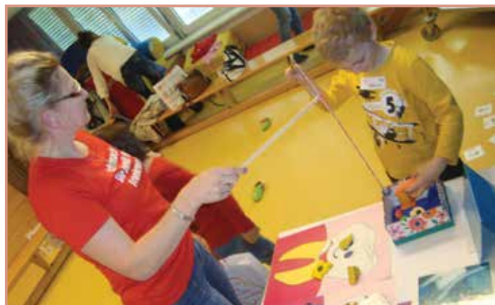
Die Spiele erfordern einiges an Geschicklichkeit.