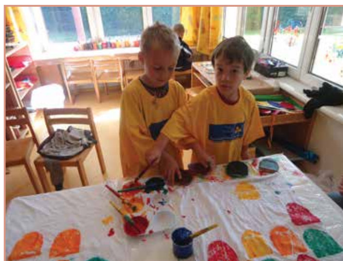
Farbe und Pinsel sind das beliebteste Werkzeug bei den Kindern.

Die Kinder und BetreuerInnen des Kinderfreunde Kindergartens wünschen allen Mauthausnerinnen und Mauthausnern einen schönen, erholsamen Sommer und freuen sich schon auf ein Wiedersehen im Herbst.