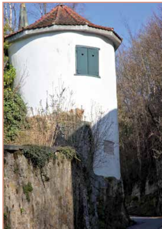
Der historische Salzturm am Kirchenberg

Diese Lösung bedarf allerdings noch einiger Diskussionen mit der betroffenen Bevölkerung. Wichtig ist, dass hier alle BewohnerInnen eingebunden werden. Nicht nur jene am Kirchenberg, sondern auch die BewohnerInnen der Hinterbergstraße, am Hochfeld, im Brunngraben, an der Parkstraße, am Höhenweg, Eschenweg, Ahornweg, am Brunnenberg und allen weiteren Siedlungen, die von einer Veränderung der Verkehrsflüsse betroffen sind. Meines Erachtens gibt es eine einmalige Chance, die Engstelle beim Salzturm zu beseitigen. Dies muss jedoch der klare Wunsch der gesamten betroffenen Bevölkerung sein.