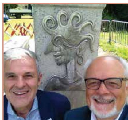
Die offizielle Eröffnung des neuen Römer-rastplatzes erfolgt im Juli 2016.

Informationen auf der Infosäule schildern die historische Situation vor rund 2000 Jahren, als sich ein großer römischer Soldatenstützpunkt am gegenüberliegenden Donauufer befand.