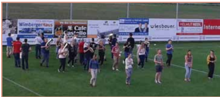
Die Marktmusik Mauthausen beim Proben für die Marschwertung