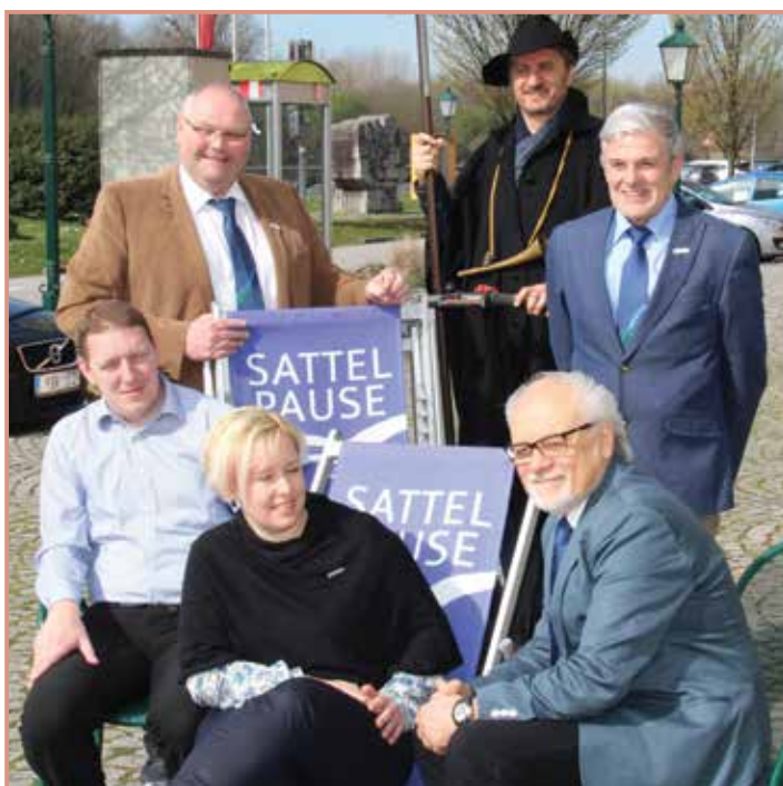
Sattelpause beim Infopoint am Heindlkai.

Die touristische Sommersaison in Mauthausen wird für Gäste mit Gratis W-Lan am Heindlkai sowie Open-Air-Veranstaltungen und Public-Viewing eröffnet. In Erfüllung seines Leitbildes sorgt der Tourismusverband Mauthausen auch heuer wieder für eine touristisch interessante Aufwertung des Donaumarktes.