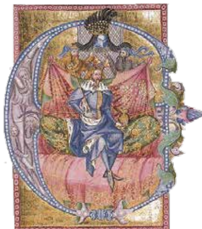
König Wenzel der Faule (1376 - 1400)