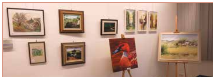
Ein Teil der ausgestellten Exponate.

Seit Pfingsten können die Werke in der Raiffeisenbank Mauthausen bewundert werden! Ein Besuch lohnt sich auch wegen der Vielfalt und Qualität der Exponate! Es ist dabei möglich ein schriftliches Angebot abzugeben. Dieses wird verbindlich bei der Versteigerung Die Kunstwerke können auch unter www.pfarre.mauthausen.at oder in einer Mappe am Tisch vor dem Pfarrbüro bewundert werden. Bei Fragen steht die Pfarre Mauthausen (07238/2303) gerne zur Verfügung.