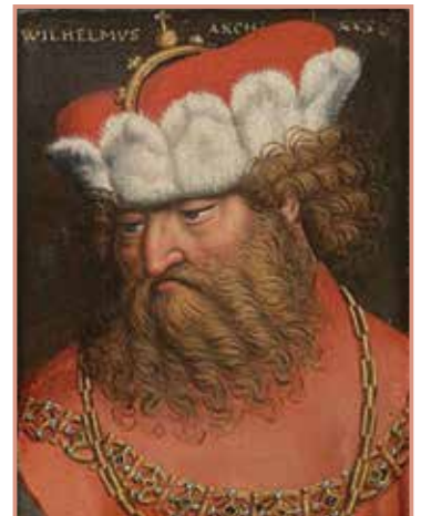
Herzog Wilhelm (1404-1406)