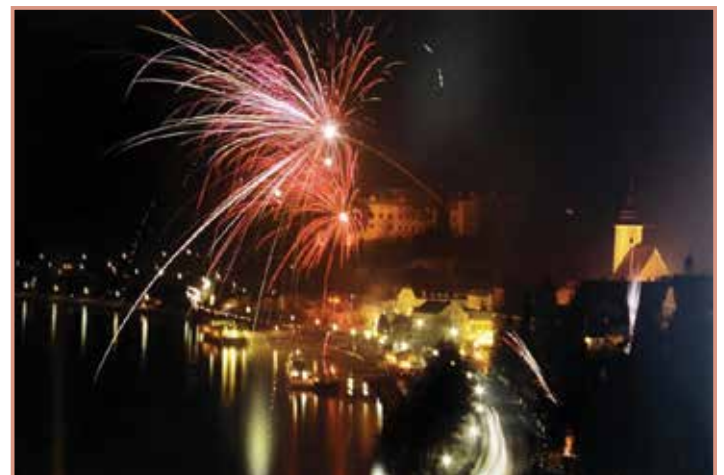
Ein Feuerwerk aus Zeiten von Donau in Flammen

Kurz vor 22:00 Uhr wird ein Feuerwerk abgeschossen. Die Greiner Wirte und Vereine werden mit einem abwechslungsreichen Angebot an Schmankerln dafür sorgen, dass auch kulinarisch keine Wünsche offen bleiben!