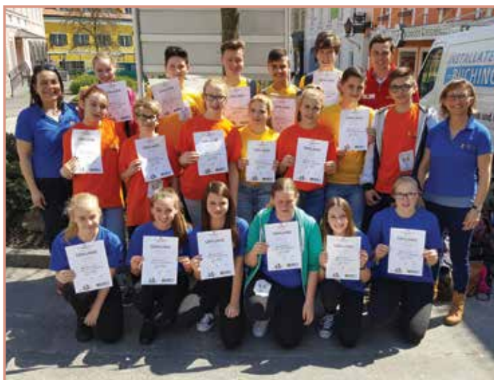
Die TeilnehmerInnen beim ersten Landeswettbewerb.

Das Team der LehrerInnen der Neuen Mittelschule Mauthausen wünscht allen MauthausnerInnen einen schönen und erholsamen Sommer.