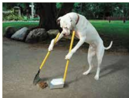
Der Hund kann nicht alleine

Wir weisen eindringlich darauf hin, dass jede/r HundehalterIn gesetzlich verpflichtet ist, die „Häufchen“ des Hundes zu entfernen. Kostenlose Hundekotbeutel entnehmen Sie den "Doggy-Stationen".