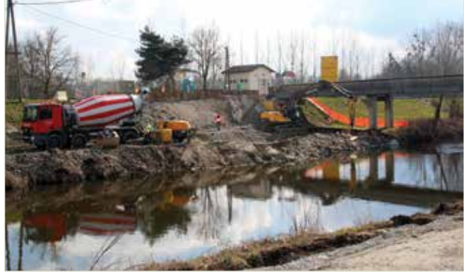
Die Bauarbeiten am Aistdamm gehen zügig voran

Eines der wichtigsten Projekte für die Sicherheit der Bevölkerung im Osten unseres Ortes ist nun voll angelaufen. Die „alte“ Seberner Brücke wurde abgerissen und durch eine neue ersetzt. Auch die Abdichtung und die Erhöhung des Dammes sind bereits voll angelaufen. Nach der Fertigstellung dieses großartigen Projektes sind wir in Mauthausen auch vor der Aist im 100-jährigen Hochwasserereignis gut geschützt.