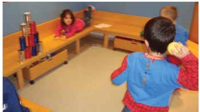
Der Duplo Bereich wurde zu einer Dosen-Schieß-Station umgebaut

Nach einer Jausenpause ging es zum Abschluss noch in die Faschingsdisco in den Bewegungsraum.