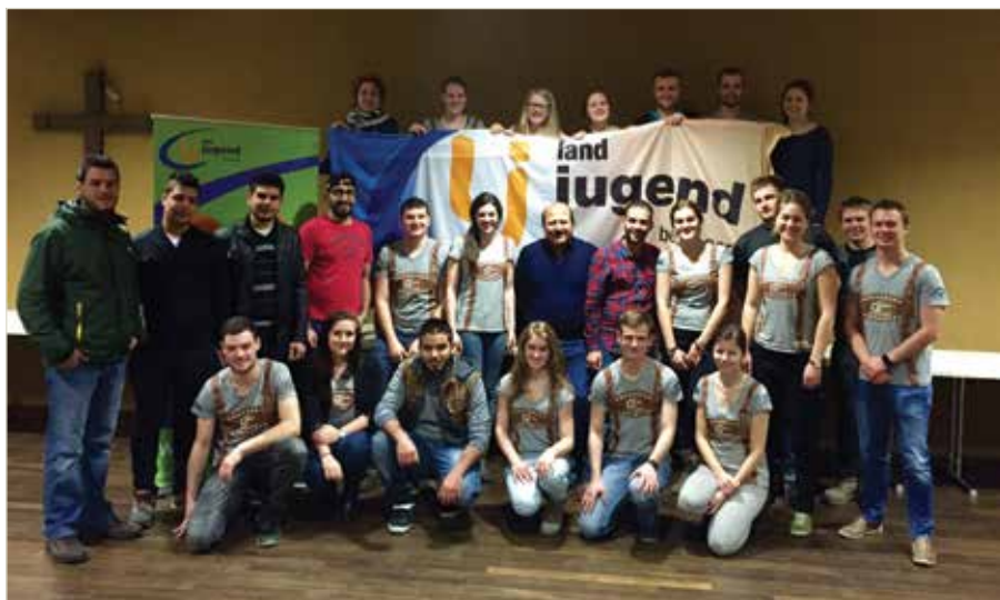
Das Team der Landjugend