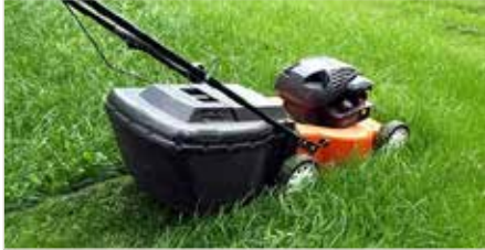
Denken Sie an Ihre NachbarInnen