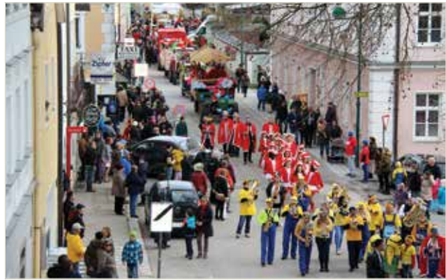
Der Zug mit den NärrInnen zieht über den Marktplatz

Das rollende Casino, die Sphinx mit ihren Mumien, jede Menge Hexen, eine Dampflock, das Notfallteam des Pensionistenverbandes, Gartenarbeiter, Himmel und Hölle und die ehem. BaumaxmitarbeiterInnen bewegten sich durch die Straßen und zeigten wieviel Spaß und Kreativität in den Mauthausnerinnen und Mauthausnern steckt. Neben den vielen Gruppen beteiligten sich viele Einzelmasken.