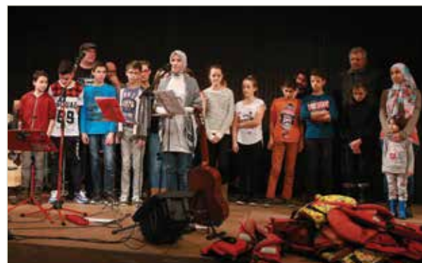
Die Schülerinnen und Schüler bei ihrem Auftritt im Donausaal

Am 23. Februar fand im Donausaal Mauthausen die alljährliche Gedenkveranstaltung zur „Mühlviertler Hasenjagd“ statt. Maßgeblich daran beteiligt waren die SchülerInnen der dritten Klassen der NMS, die sich heuer zu einer umfassenden Ausbildung zu „Konfliktlotsen“ entschieden hatten. Die Initiative „perspektive mauthausen“ gab das Thema „Fluchtpuren“ vor, welches von den SchülerInnen aufgegriffen und bezugnehmend auf die aktuelle Situation bearbeitet wurde.