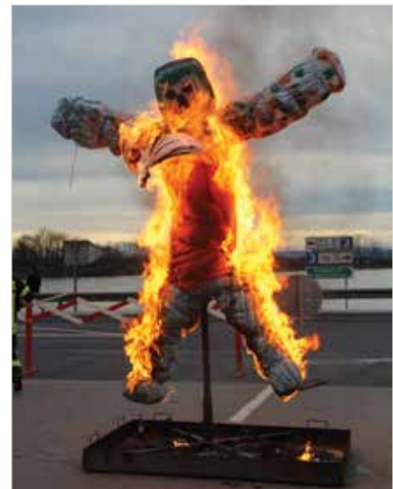
Traditionell wird am Ende des Faschingsumzuges der Fasching verbrannt

Einen Rückblick mit vielen Fotos gibt es auf der Homepage der Gemeinde Mauthausen. Herzlichen Dank den Fotografen Hans Maly und Franz Affenzeller.