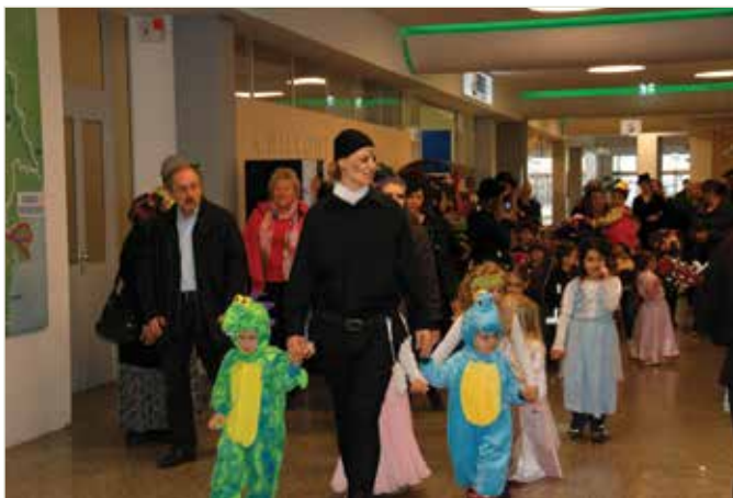
Der Umzug kann beginnen!

Mit einem lauten „Mau-Mau“ wurden die Eltern, EinkäuferInnen und die Geschäftsleute von den Kindern bei ihrem Faschingsumzug durch den Donaupark begrüßt. Ein großes Dankeschön ergeht an die Geschäftsführung, das Spielparadies sowie an die Firma Brandner für die Geschenke.