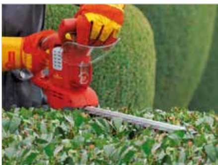
Tragen Sie zur Verkehrssicherheit bei!

Die GrundstückseigentümerInnen werden daher gebeten, die Sträucher und Hecken entsprechend zu schneiden und damit die nötige Verkehrssicherheit wiederzugeben.