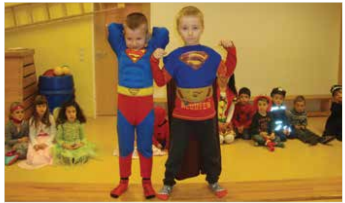
Ein wahrer Superman darf im Fasching nicht fehlen