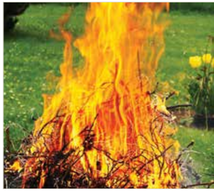
Das Verbrennen von Grünschnitt ist verboten!