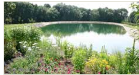
Die Befüllung ist schriftlich anzumelden.

Bei erstmaliger Befüllung wird keine Kanalbenutzungsgebühr verrechnet. Für jede weitere Befüllung sind sowohl die Wasserbezugs- als auch Kanalbenutzungsgebühren zu entrichten.