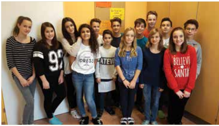
Die ausgebildeten KonfliktlotsInnen