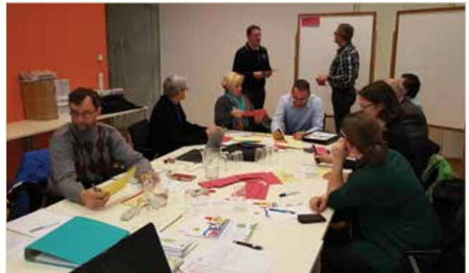
Die Teilnehmer am Startworkshop der Fahrradberatung

Am 10. März fand im Gemeindeamt der Startworkshop zur „Fahrradberatung“ in Mauthausen statt. Mit Unterstützung des Landes Oberösterreich werden wir uns in den kommenden Wochen und Monaten der Verbesserung des Radwegenetzes in Mauthausen widmen. Sicherheit der Fahrradfahrerinnen und Fahrradfahrer sowie ein besseres Bewusstsein, bei kurzen Strecken auch einmal auf das Auto zu verzichten, sind die wesentlichen Ziele des Arbeitskreises. Ich bedanke mich bei allen TeilnehmerInnen, die sich gemeinsam für mehr Sicherheit und Gesundheit in unserer Gemeinde engagieren.