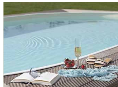
Poolbefüllungen sind anzumelden

Das Befüllen eines Schwimmbades kann über die hauseigene Wasserleitungsanlage bzw. über Hydranten durch die Feuerwehr erfolgen. Dafür ist die Kanalbenutzungsgebühr zu bezahlen, da die Schwimmbäder in der Regel auch am örtlichen Kanalnetz hängen und über dieses rückgespült und das Wasser auch ausgelassen wird. Schwimmbadabwässer sind sogenannte bedenkliche Abwässer und müssen somit in den Kanal geleitet werden.