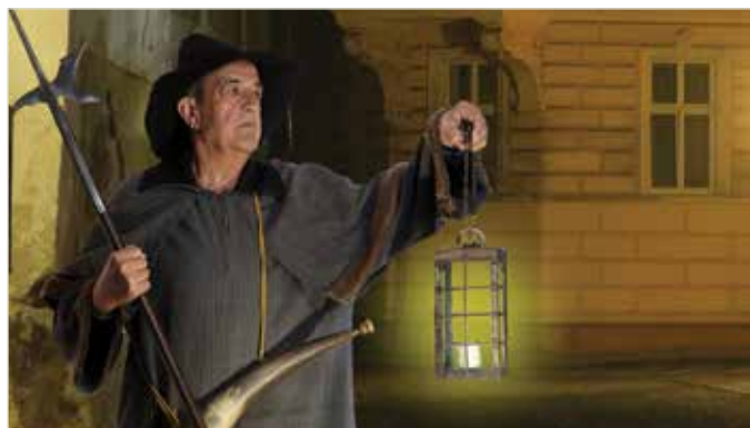
Der Nachtwächter bei seinem Rundgang

Vollmond-Roas mit dem Nachtwächter (optional mit anschließender Nachtwächterjause in einem zentrumsnahen Gasthaus)