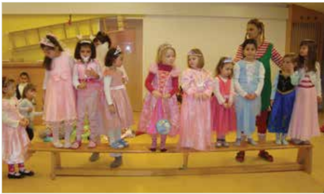
Alle Kinder beteiligen sich bei der Kostümshow