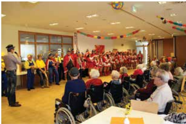
Eine spezielle Vorstellung gab es für die BewohnerInnen des Senioriums

Die Flüchtlinge als Spongebob-Schwammköpfe überließen ihre Masken den begeisterten Kindern. Mancher Spongebob ziert heute noch ein Kinderzimmer. Mit dabei waren die Marktmusik, die Garde und das Narrentaxi der Gemeinde, welche den Narrenzug anführten.