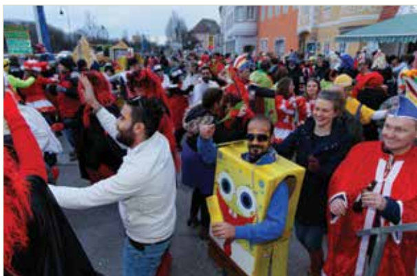
Ausgelassene Stimmung am Heindlkai

Für einen gelungen Abschluss sorgte das Cafe Castello, wo sich noch viele nach dem offiziellen Ende und dem „Verbrennen des Faschings“ am Heindlkai vergnügten. Herzlichen Dank den Labstellenbetreibern, den SpenderInnen der Preise, der Feuerwehr, der Polizei, den Bauhofmitarbeitern, der Marktmusik, der Garde, dem Seniorenheim, dem